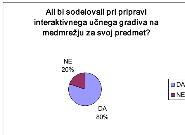
Graf: Ali bi sodelovali pri pripravi interaktivnega učnega gradiva na medmrežju za svoj predmet? (n=15)

Ena izmed ugotovljenih pomanjkljivosti je premalo e-gradiv, zato bomo v leto 2007 za naše predavatelje pripravili dve delavnici za pripravo e-gradiv. Glede na rezultate samoevalvacije, v kateri smo učitelje tudi povprašali, če bi sodelovali v projektni skupini za pripravo interaktivnega učnega gradiva na medmrežju za svoj predmet, predvidevamo, da bo udeležba na delavnici dobra.